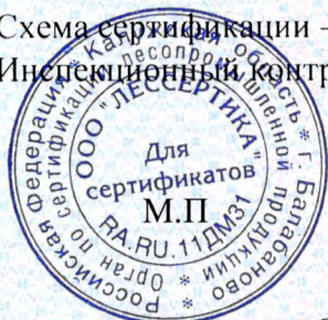
Схема сертификации – Зс. Инспекционный контроль – февраль 2021 года, февраль 2022 года.